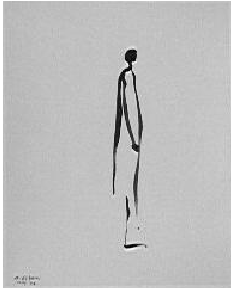
Skiss (30 cm x 42 cm)