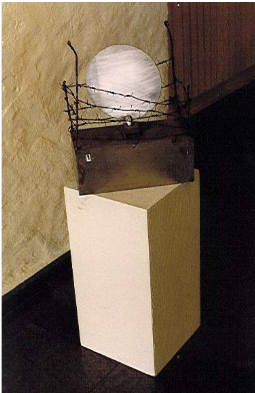
Form, Pascals gud, metall