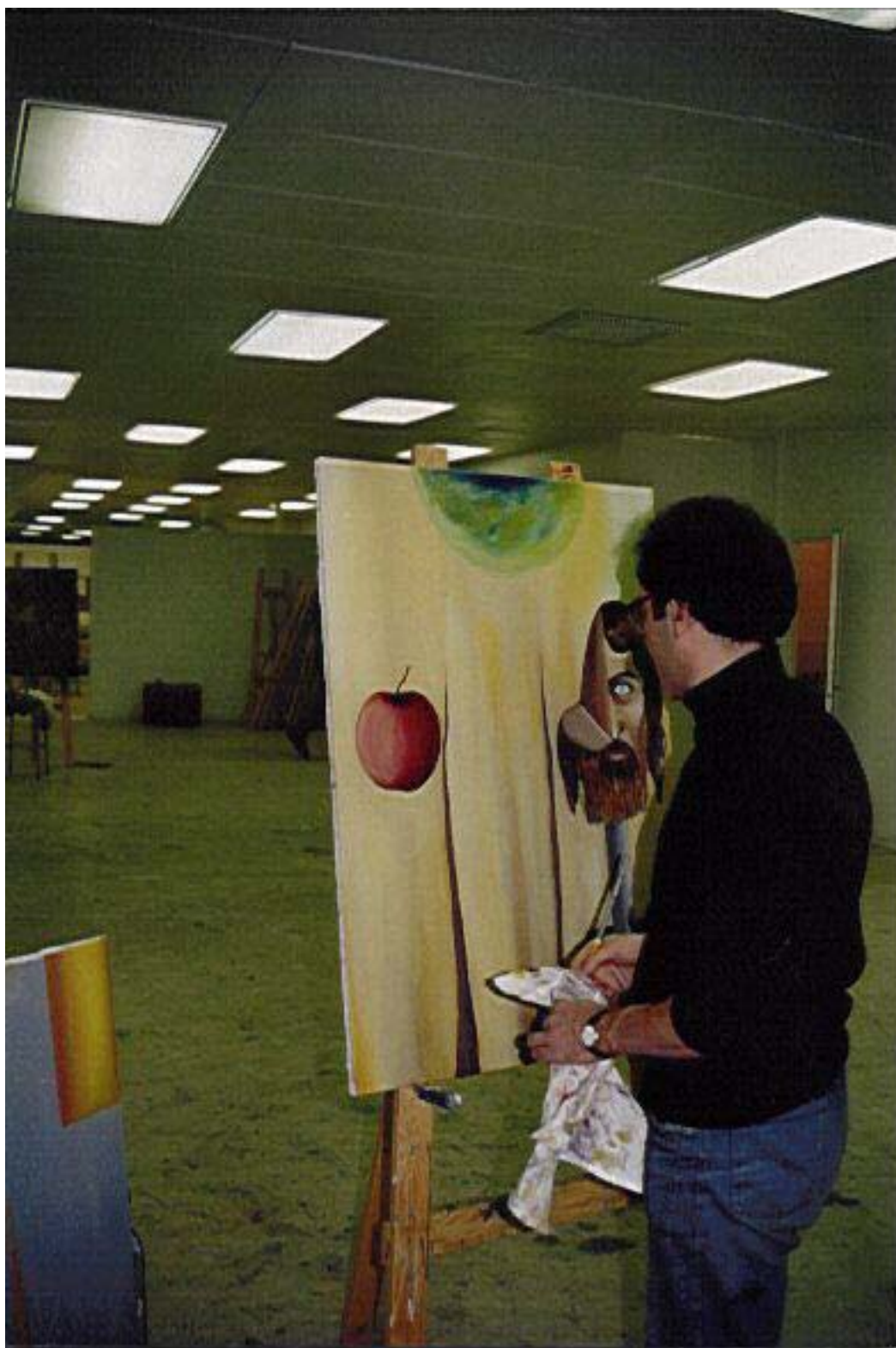
Foto, arbete på ateljé