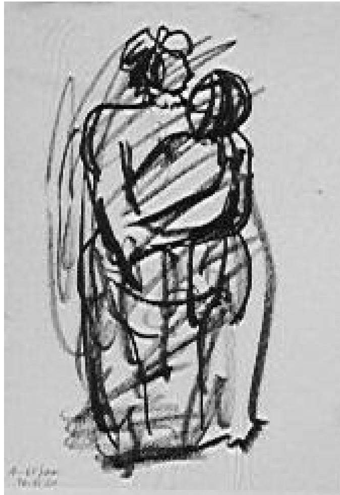
Skiss (30 cm x 42 cm)