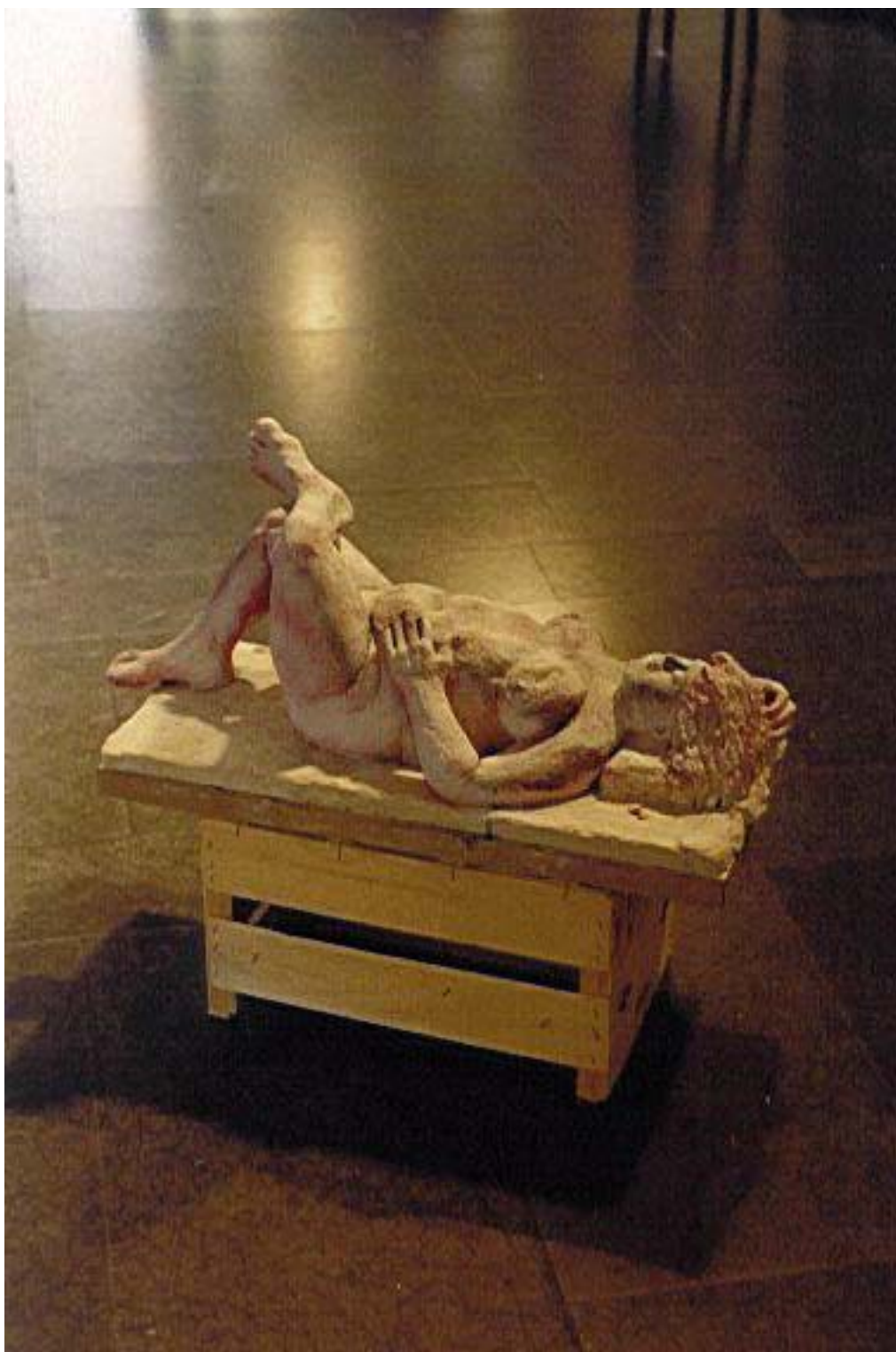
Skulptör, modell, lera