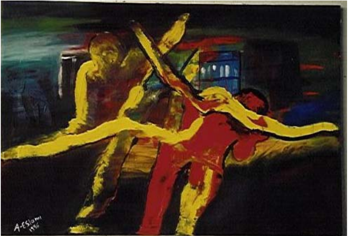
Dödsdans, oljemålning på duk (50 cm x 70 cm)