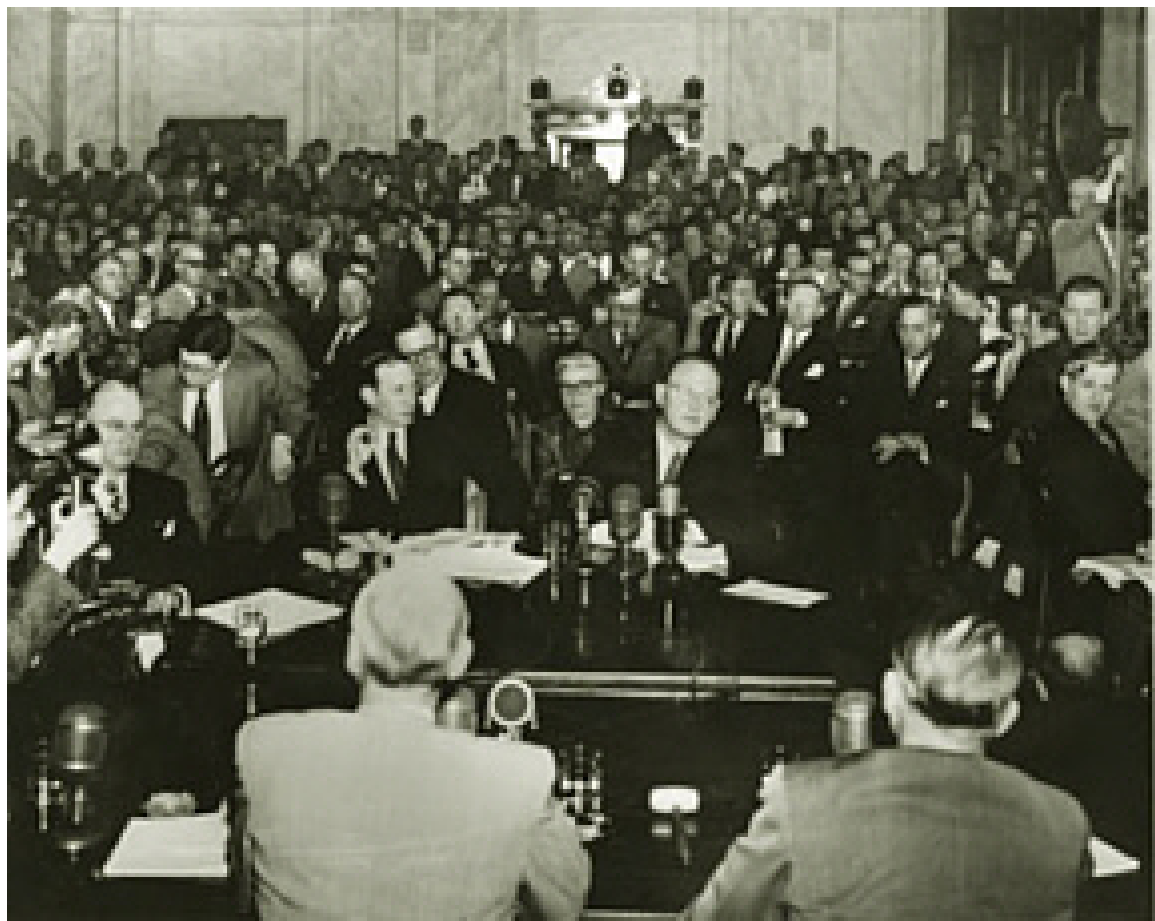
بازجویی اون لاتیمر (Owen Lattimore) روزنامه نگار

هدف مک کارتی، برچسب زدن به مخالفان سیاسی، به ویژه روشنفکران برای بی اعتبار کردن آنان در نزد توده مردم به نام پیشگیری از نفوذ کمونیسم بود. چارلی چاپلین توصیفی گویا از دوران مک کارتیسم ارائه داده است: "... در آمریکا روزگاری را می‌گذرانیم که اگر کسی صبح، هنگام خارج شدن از خانه اول پای چپش را بیرون بگذارد به کمونیست بودن متهم می‌شود."