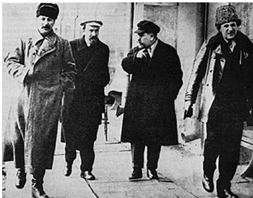
استالین و با سه تن از رهبران حزب بلشویک (ریکف، کامینف و زینویف) که هر سه قربانی پاکسازی گسترده او شدند.

در این دادگاه ها که اتهامات جملگی جعلی بود، متهمین به گناه خود اعتراف کرده و خواهان مجازات خود می شدند. یکی از متهمان اجازه می خواهد که رفقا و همسرش را تیرباران کند و دیگران می خواهند که حکم اعدام آنها صادر شود و برای این کار از دادستان تشکر می کنند. سرگئی مارچوکوسکی اقرار می کند: "من خائن به حزب خود بودم، خائنی که باید تیرباران شود." ادوارد هولتزمن اعتراف می کند: "ما تنها قاتل نیستیم، بلکه قاتل های فاشیست هستیم."